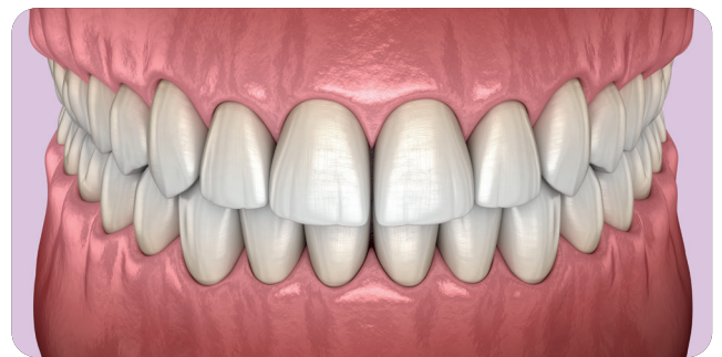
Dents soignées suite au détartrage.